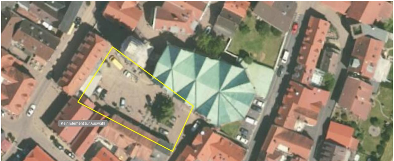
Parkplatz Rathaus / Kirchplatz am Stiftshof