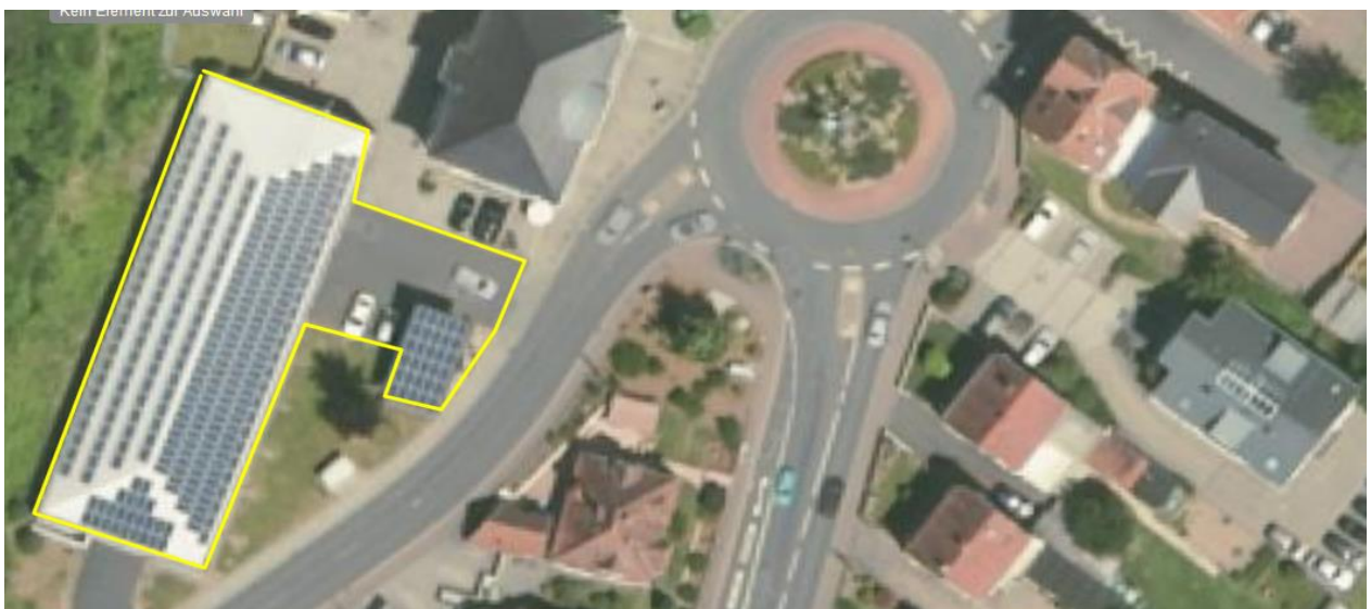
Parkhaus Wendelinuskreisel, der Öffentlichkeit zugänglichen und nutzbaren Bereichen, einschl. der unteren Zufahrt ins Parkhaus vorgelagerter Parkflächen