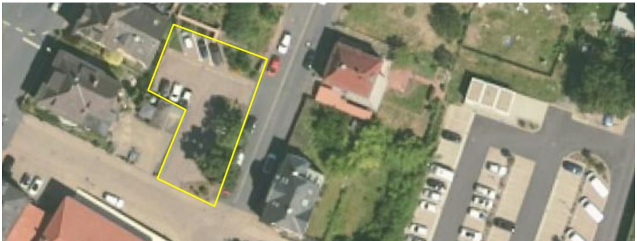
Parkplatz Frühlingstraße Ecke Römergässchen