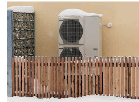
Luft-Wärmepumpe mit Lärmschutz