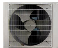
An den Ventilator-schaufeln entstehen Wirbel und Druckschwankungen, die als Lärm abgestrahlt werden.

Auch wenn Luft-Wärmepumpen in der Regel genehmigungsfrei installiert werden können, müssen sie so betrieben werden, dass von ihnen keine schädlichen Umwelteinwirkungen durch Lärm ausgehen.